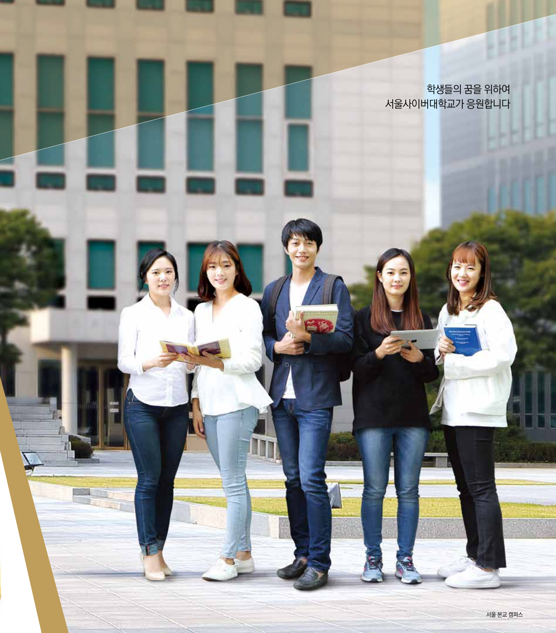
서울 본교 캠퍼스