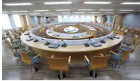
• 3개국어 동시 통역 가능한 국제회의실

셀럽의 일류특강, 학업의 질을 높이는 오프세미나, 교수님과 직접적인 소통의 기회 등 학생의 학업을 위한 국내 최대독립 인텔리전트 교육시설을 완비한 서울사이버대학교의 캠퍼스