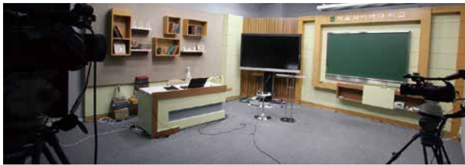
• 방송국 수준의 대형 스튜디오