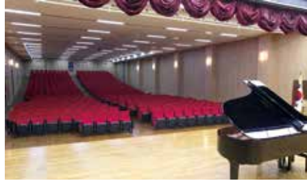
• 첨단공연시설을 갖춘 차이콥스키홀